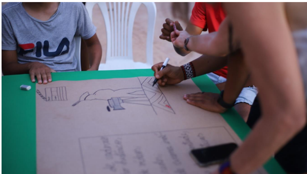
Após implementação dos questionários, os presentes foram divididos em grupos e sistematizaram as questões. Encontro Plantando Sementes e Curando Vidas - Território Tingui-Botó, março de 2023.

Enfim, destaca-se a importância da questão dos indígenas que vivem na região urbana.