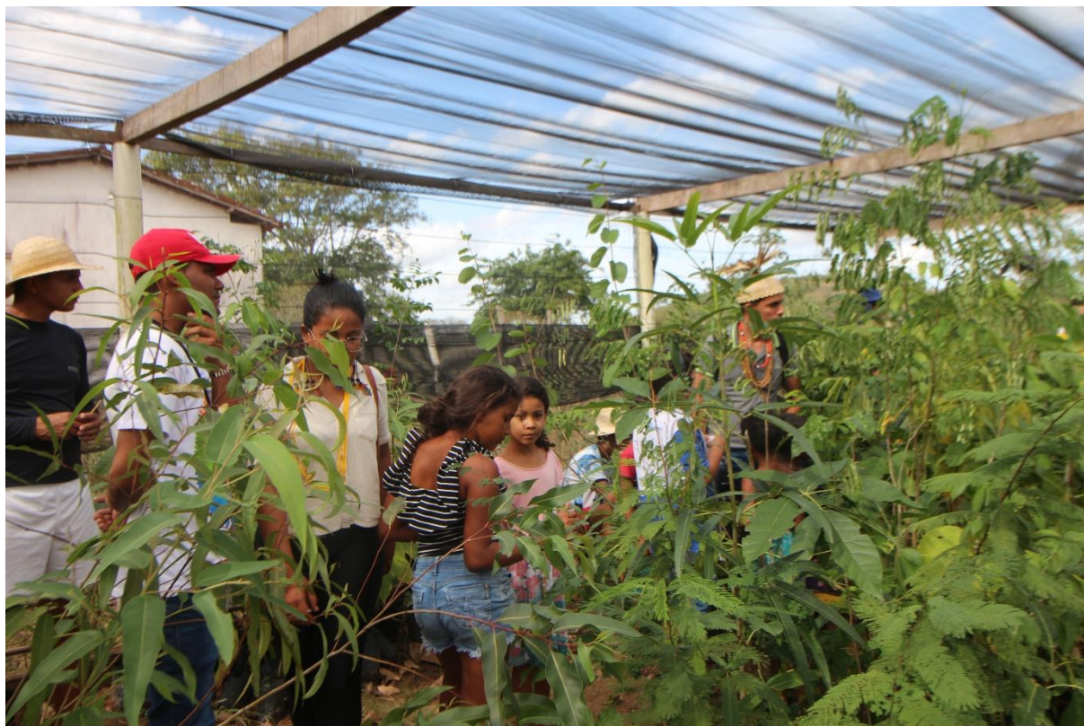
Encontro Plantando Sementes e Curando Vidas - Território Tingui Botó.

natureza. É nesta religiosidade que se apoiam diversas práticas de cuidado do território e dos indivíduos. O reflorestamento e plantios, quase diários, através de mudas ou estaqueamento, tem uma importância considerável. Tais atividades são principalmente realizadas pelos mais antigos, mas também pelos mais jovens que entendem sua importância espiritual. Também são realizados trabalhos de cuidado a partir da medicina da floresta, que os Tingui Botó chamam de “medicina verde” e que se baseiam no conhecimento ancestral. Assim, entendemos que todas as narrativas deste povo, sejam elas artística, medicinal, ou agrícola, vem da vertente espiritual.