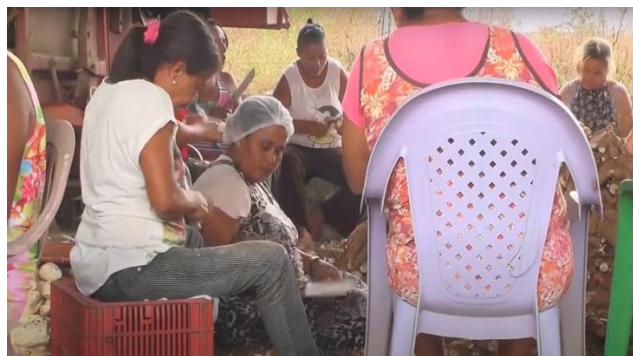
Imagens do filme “Casa de Farinha Tingui Botó”.

plantações de mandioca e batata doce. Todos os anos nos meses de junho é feito o plantio, um processo que envolve toda comunidade em momentos coletivos onde cada família planta sua roça e todos ajudam em mutirões. É conhecido no território como a “turma da onça”. Todo este processo coletivo resulta na produção de alimento. Cabe salientar que a Casa de Farinha Tingui não é apenas um local onde se faz farinha para consumo, é também um lugar onde se reúnem as famílias e se trocam histórias que são vivenciadas por toda a comunidade. É um processo de resistência e soberania alimentar que atravessa décadas e é transmitido para as novas gerações.