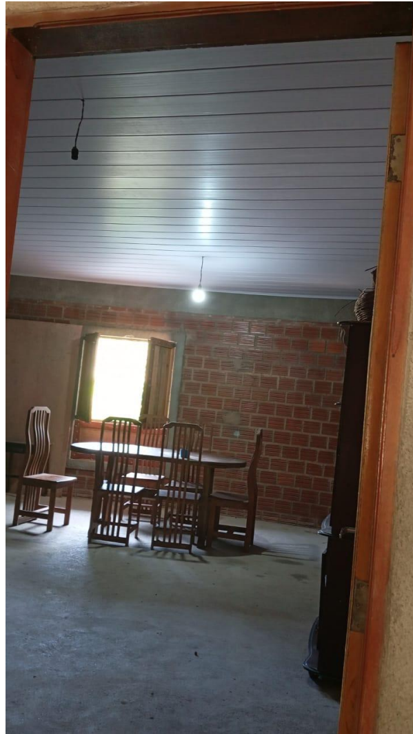
Imagem 7 - Registro fotográfico Reforma de Casa de Sementes do Caxo no Território Xukuru do Ororubá