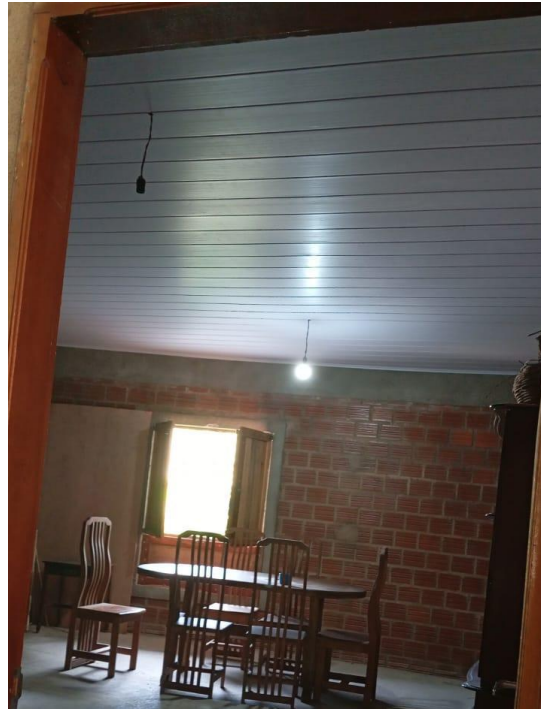
Imagem 2 - Registro fotográfico Reforma de Casa de Sementes do Caxo no Território Xukuru do Ororubá