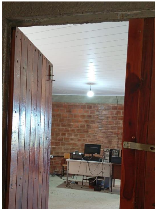
Imagem 3 - Registro fotográfico Reforma de Casa de Sementes do Caxo no Território Xukuru do Ororubá