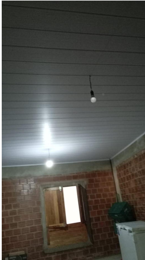
Imagem 9 - Registro fotográfico Reforma de Casa de Sementes do Caxo no Território Xukuru do Ororubá