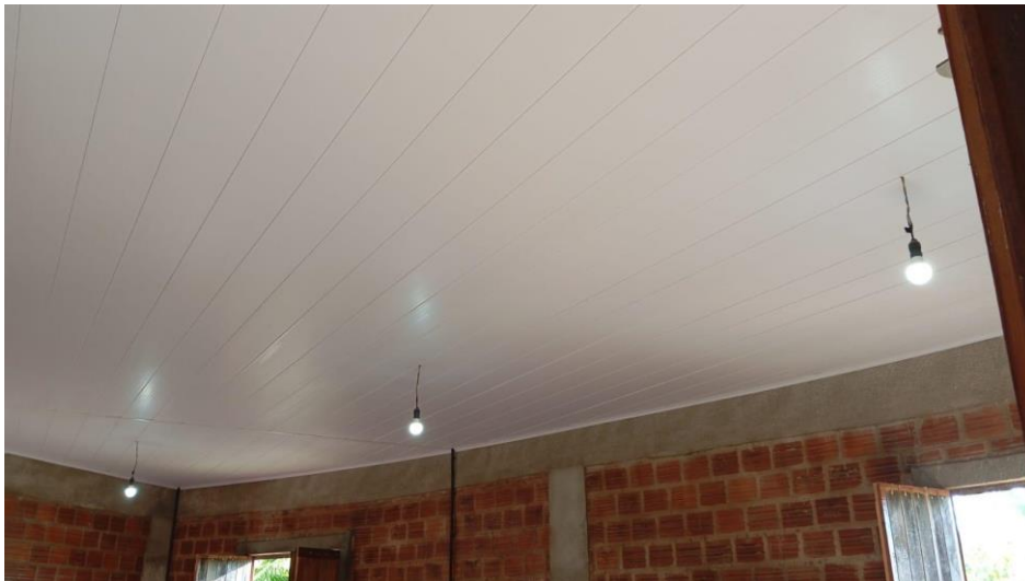
Imagem 5 - Registro fotográfico Reforma de Casa de Sementes do Caxo no Território Xukuru do Ororubá