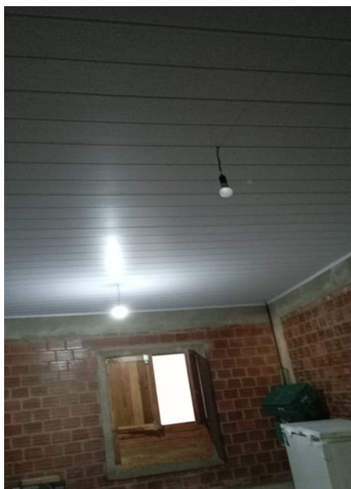
Imagem 1 - Registro fotográfico Reforma de Casa de Sementes do Caxo no Território Xukuru do Ororubá

Nesse relatório são delineados objetivos específicos, os métodos de coleta e análise empregados e os principais resultados alcançados. Também está sendo elaborado um modelo de material didático/informativo (caderno) a ser construído para utilização