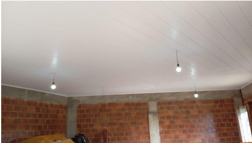
Imagem 4 - Registro fotográfico Reforma de Casa de Sementes do Caxo no Território Xukuru do Ororubá